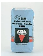
KEIM Universalputz Fein

Es handelt sich dabei um ein Kupfergewebe, das sich ideal zum Einsatz im Außenbereich in Putzsystemen und/oder unter Wärmedämmverbundsystem eignet.